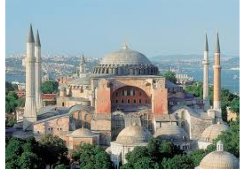
Аја Софија споља